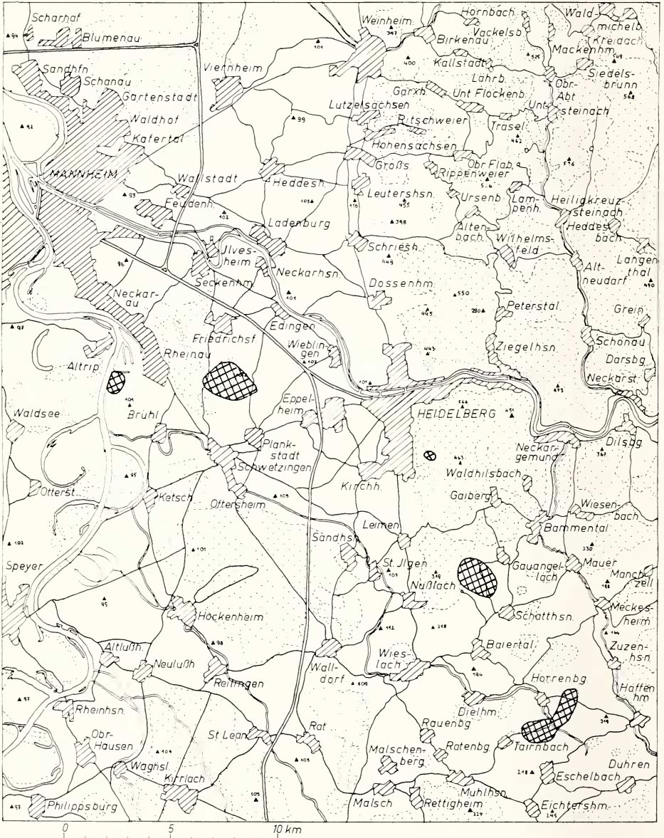
Abb. 1. Die Untersuchungsflächen (doppelt schraffiert). Schraffiert: Siedlungsgebiete; gepunktet: Wald; ohne Signatur: landwirtschaftlich genutzte Flächen

Während eine quantitative Beschreibung der Nahrungszusammensetzung des Rotfuchses aus der Auswertung der gesammelten Proben nicht möglich wird, lassen sich jedoch Aussagen über die Häufigkeit des Auftretens einzelner Beutekomponenten machen. Es werden daher in Tab. 1 und Abb. 2 stets die Anzahl der Proben aufge-